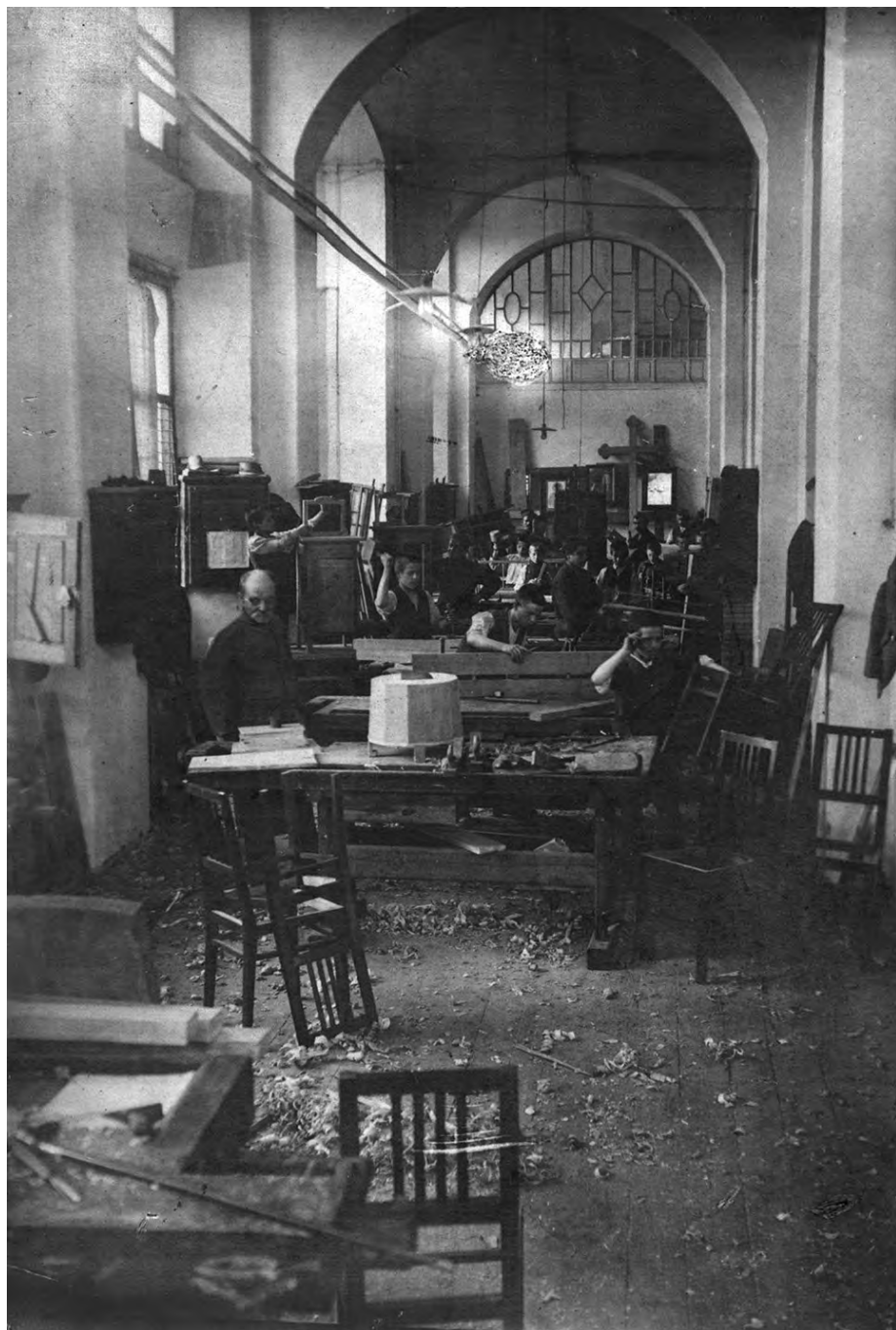
Fot. 3. Oświęcim. Pracownia stolarska od 1902 roku w piwnicy wschodniej części głównego skrzydła zakładu (do 1912) o powierzchni 174 metrów kwadratowych