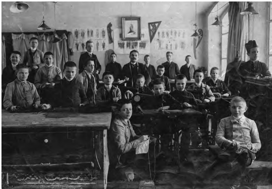
Fot. 4. Zakład im. Księstwa Bosko 1908. Rzemieślnicza pracownia krawiecka