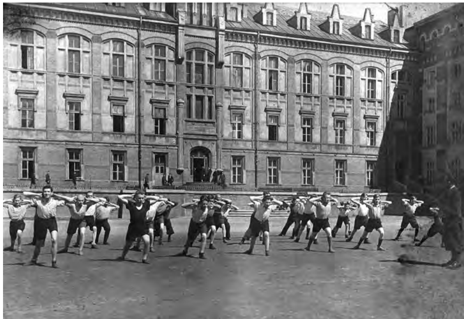
Fot. 11. Oświęcim. Wychowankowie zakładu i członkowie koła gimnastycznego w czasie ćwiczeń na podwórku św. Jacka w Zakładzie im. Księdza Bosko