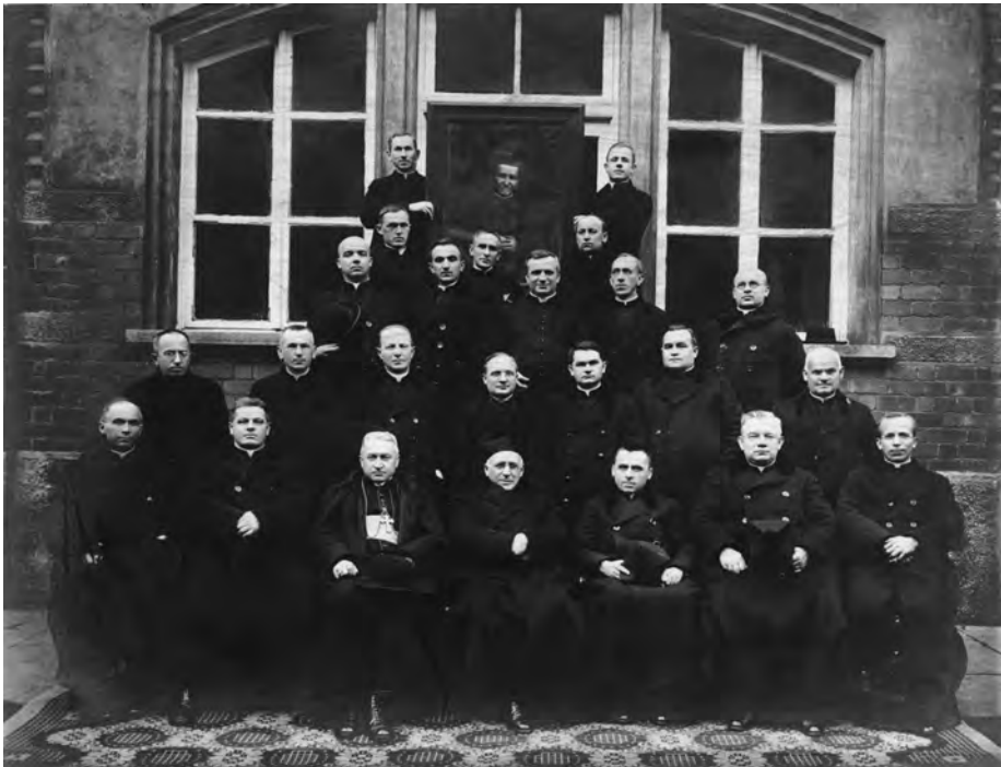
Fot. 2. Oświęcim. Wizytacja Księdza Generała Filipa Rinaldi w Polsce, 1–22 X 1925.

li miasta. W imieniu przełożonych i rozentuzjarmowanej młodzieży przemówił zasłużony i kochany ks. Piotr Tirone, inspektor prowincji polskiej. W przemówieniu dziękczynnym wyraził najprzewielebniejszy ks. generał [Filip Rinaldi] serdeczną radość, jaką napełnione było jego serce, dlatego, iż mógł zobaczyć z bliska rozwój dzieł ks. [Jana] Bosko w Polsce, ku której zawsze, szczególniejsze żywił uczucia sympatii. W czasie dwudniowego pobytu w zakładzie, zwiedził najpierw najprzewielebniejszy ks. generał [Filip Rinaldi] pracownie nasze w towarzystwie ks. kierownika i innych przełożonych.